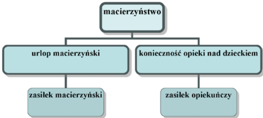
Rysunek 2. Rodzaje ryzyk i świadczenia wypłacane z tytułu macierzyństwa